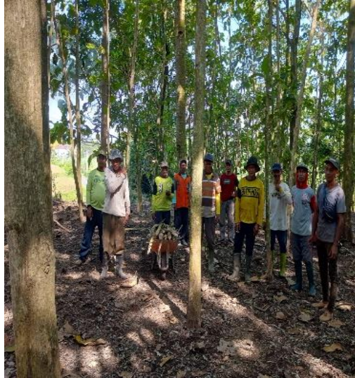
Gambar 3. Yang Terlibat

terdiri dari pekerja inti dan pekerja musiman terlibat aktif dalam seluruh tahapan kegiatan, mulai dari perencanaan, penanaman, hingga pemeliharaan kayu jati pada lahan lebih dari 10 hektar yang tersebar di beberapa desa. Peningkatan partisipasi ini tidak hanya terlihat dari kehadiran fisik, tetapi juga dari keterlibatan dalam pengambilan keputusan, seperti penentuan lokasi lahan dan pembagian kerja.