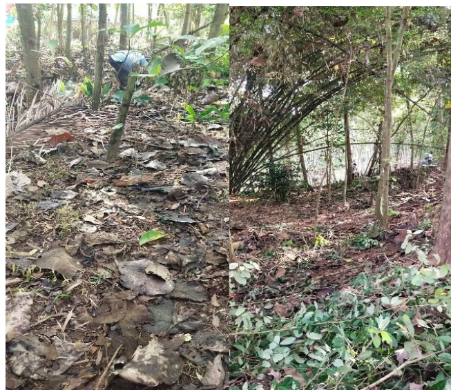
Gambar 2. Lahan

Pendekatan ini sejalan dengan konsep sustainable land management , yaitu pengelolaan sumber daya lahan secara berkelanjutan untuk menjaga keseimbangan fungsi ekologis dan ekonomi. Melalui kegiatan ini, lahan yang sebelumnya tidak produktif mulai berubah menjadi kawasan penghijauan produktif berbasis masyarakat.