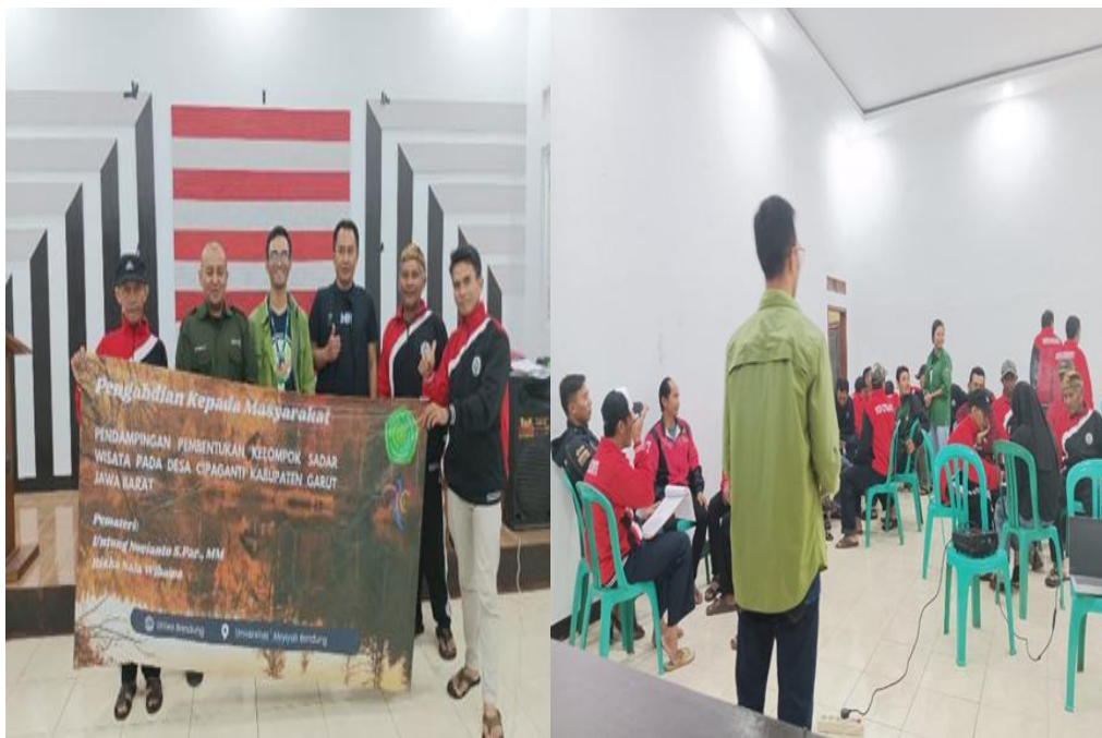
Gambar 2. Pelaksanaan Kegiatan

Ketiadaan kelompok sadar wisata sebagai organisasi penggerak menjadi salah satu hambatan utama dalam pengembangan sektor pariwisata di Desa Cipaganti. Kelompok sadar wisata atau Pokdarwis merupakan institusi penting dalam pengelolaan desa wisata karena berfungsi sebagai fasilitator penghubung antara masyarakat pemerintah dan sektor swasta dalam pengembangan pariwisata berbasis komunitas. Pokdarwis juga berperan dalam meningkatkan kesadaran masyarakat terhadap pentingnya pelayanan wisata konservasi lingkungan serta pengembangan ekonomi kreatif berbasis potensi lokal. Studi menunjukkan bahwa keberadaan Pokdarwis berkontribusi signifikan terhadap peningkatan kapasitas masyarakat dalam mengelola destinasi wisata secara mandiri dan berkelanjutan (Sutrisno, 2022). Tanpa adanya struktur organisasi yang jelas potensi wisata cenderung tidak berkembang secara optimal karena tidak adanya koordinasi dalam pengelolaan sumber daya serta kurangnya strategi pemasaran yang terintegrasi.