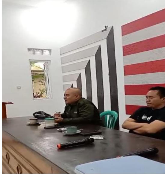
Gambar 4. Pembentukan Pokdarwis dengan Kepala Desa

Pembentukan kelembagaan kegiatan ini juga menghasilkan peningkatan keterampilan masyarakat dalam pengolahan kopi menjadi produk bernilai tambah seperti kopi sangrai kopi bubuk dan minuman kopi siap saji yang dapat dijadikan sebagai daya tarik wisata Edukasi mengenai proses pengolahan kopi dari hulu hingga hilir menjadi bagian dari paket wisata yang dikembangkan sehingga wisatawan tidak hanya menikmati produk tetapi juga mendapatkan pengalaman belajar secara langsung Pendekatan ini terbukti efektif dalam meningkatkan nilai ekonomi produk kopi karena memberikan diferensiasi yang tidak dimiliki oleh produk kopi konvensional (Richards, 2021)