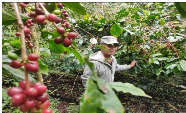
Gambar 1. Perkebunan Kopi Desa Cipaganti Garut

Kondisi ini menyebabkan nilai ekonomi yang dihasilkan dari sektor kopi masih bergantung pada penjualan bahan mentah tanpa adanya diversifikasi produk atau pengembangan wisata berbasis pengalaman. Pengembangan desa wisata berbasis potensi lokal terbukti mampu meningkatkan kesejahteraan masyarakat melalui penciptaan lapangan kerja serta peningkatan pendapatan rumah tangga sebagaimana dijelaskan dalam kajian pengembangan desa wisata berbasis komunitas yang menekankan pentingnya kelembagaan lokal dalam mengelola potensi desa secara berkelanjutan (Nugroho, 2021)