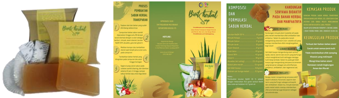
Gambar 3. Ilustrasi kemasan produk sabun herbal transparan

mengurangi kelembaban (Maulida dkk., 2017). Identitas merek 'BIOITSHERBAL dan dilengkapi dengan informasi komposisi, berat bersih, khasiat dan manfaat, tanggal kadaluarsa produk dan kontak produsen (Rambe dan Afifuddin, 2012). Ilustrasi kemasan produk sabun herbal transparan disajikan pada Gambar 3.