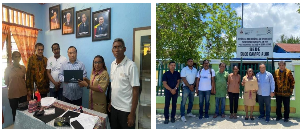
Gambar 3. Pemberian cinderamata laptop

Setelah melakukan pembukaan kegiatan pengabdian kepada masyarakat, dilanjutkan pelatihan dan workshop. Antusiasme partisipan sangat terlihat manakala narasumber memberikan praktek penggunaan hyperlink ke dokumen dan social media . Selain itu, narasumber juga menjelaskan langkah-langkah media pembelajaran digital yang dapat digunakan oleh guru SD, SMP dan SMA. Wujud dari pelatihan dan workshop ini juga didukung dengan bantuan cinderamata laptop sebagai alat untuk pengembangan program digital.