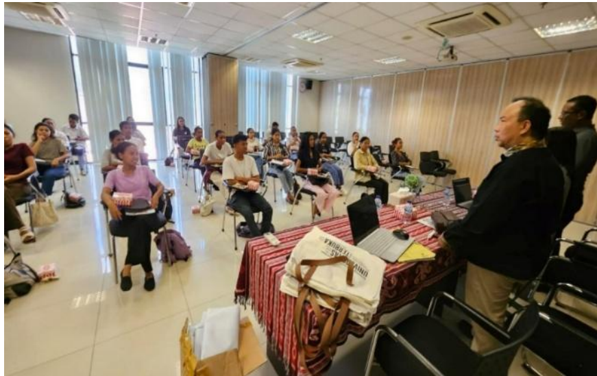
Gambar 2. Pembukaan kegiatan Pengabdian kepada Masyarakat

memilih dan merancang media yang sesuai dengan materi yang disampaikan untuk membantu mencapai tujuan belajarnya.