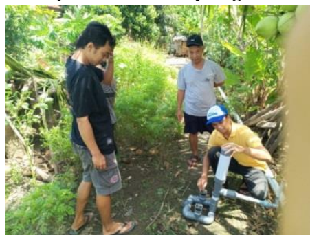
Gambar 5. Demonstrasi Perawatan Pompa Hidram

Pompa hidram yang didemonstrasikan bisa naik dari permukaan sungai ke lahan pertanian pemilik lahan. Debit air pada output pompa mengatasi permasalahan irigasi. Hasil kuesioner menunjukkan sebanyak 75 % peserta (6 dari 8 orang mengaku memahami langkah-langkah pembuatan pompa hidram, sedangkan 25% sisanya (2 dari 8 orang) mengaku tidak memahami langkah-langkah tersebut (mereka adalah peserta wanita yang berusia 75 dan 53 tahun). Selanjutnya, pada tahapan penggunaan pompa hidram, 50 % peserta (4 dari 8 peserta) yang semuanya laki-laki mengaku memahami penggunaan pompa hidram, sedangkan 50 % lainnya (4 peserta perempuan) kurang memahami langkah-langkah penggunaan pompa hidram. 3) Pada kegiatan demonstrasi perawatan pompa hidram, sebanyak 87,5 % (7 dari 8 peserta) mengaku memahami langkah-langkah perawatan pompa hidram yang meliputi pengecekan katup serta saluran input dan output. 1 dari 8 peserta atau 12,5 % peserta mengaku kurang memahami cara perawatan pompa hidram (peserta tersebut adalah wanita pemilik lahan yang berusia 75 tahun).