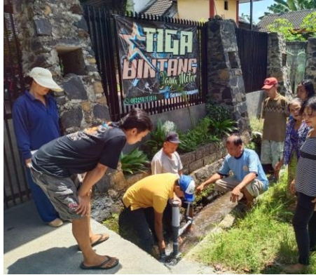
Gambar 4. Demonstrasi Penggunaan Pompa Hidram

Pompa hidram yang didemonstrasikan bisa naik dari permukaan sungai ke lahan pertanian pemilik lahan. Debit air pada output pompa mengatasi permasalahan irigasi. Hasil kuesioner menunjukkan sebanyak 75 % peserta (6 dari 8 orang mengaku memahami langkah-langkah pembuatan pompa hidram, sedangkan 25% sisanya (2 dari 8 orang) mengaku tidak memahami langkah-langkah tersebut (mereka adalah peserta wanita yang berusia 75 dan 53 tahun). Selanjutnya, pada tahapan penggunaan pompa hidram, 50 % peserta (4 dari 8 peserta) yang semuanya laki-laki mengaku memahami penggunaan pompa hidram, sedangkan 50 % lainnya (4 peserta perempuan) kurang memahami langkah-langkah penggunaan pompa hidram. 3) Pada kegiatan demonstrasi perawatan pompa hidram, sebanyak 87,5 % (7 dari 8 peserta) mengaku memahami langkah-langkah perawatan pompa hidram yang meliputi pengecekan katup serta saluran input dan output. 1 dari 8 peserta atau 12,5 % peserta mengaku kurang memahami cara perawatan pompa hidram (peserta tersebut adalah wanita pemilik lahan yang berusia 75 tahun).