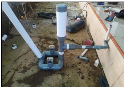
Gambar 3. Pompa Hidram

Berdasarkan hasil kuesioner, semua peserta mengaku bahwa sosialisasi ini menarik dan sesuai dengan kebutuhan akan solusi atas permasalahan yang dialami pada sawah mereka yaitu permasalahan irigasi sawah pada dataran tinggi yang berada di atas permukaan sungai. Kemudian, pada kegiatan demonstrasi aplikasi pompa hidram ini, tim pelaksana mendemonstrasikan cara menggunakan pompa hidram pada lahan \pm 1,5 meter diatas permukaan sungai.