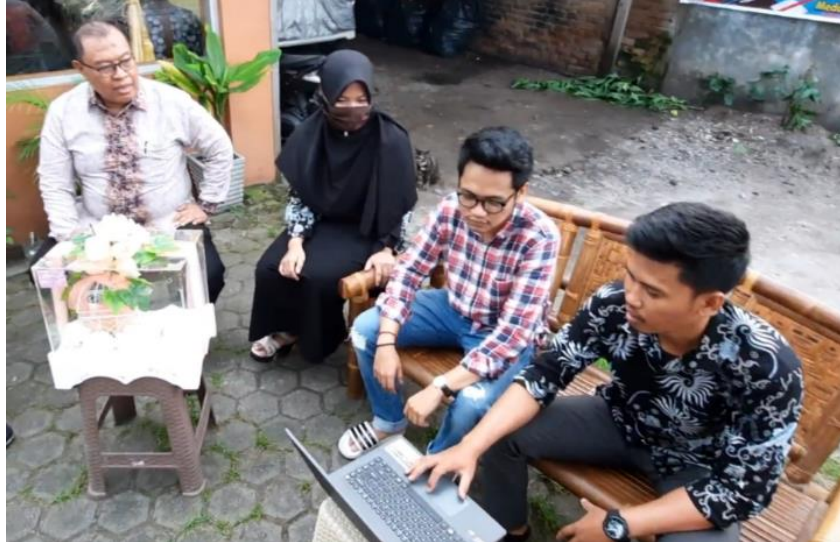
Gambar 3. Penjelasan tentang website

Dari sekian banyak permasalahan yang dihadapi oleh mitra (Wedding Organizer Hantaran Medan), beberapa permasalahan sudah dapat diatasi oleh tim pengabdian Universitas Dharmawangsa sekaligus memberikan solusi dari permasalahan tersebut.