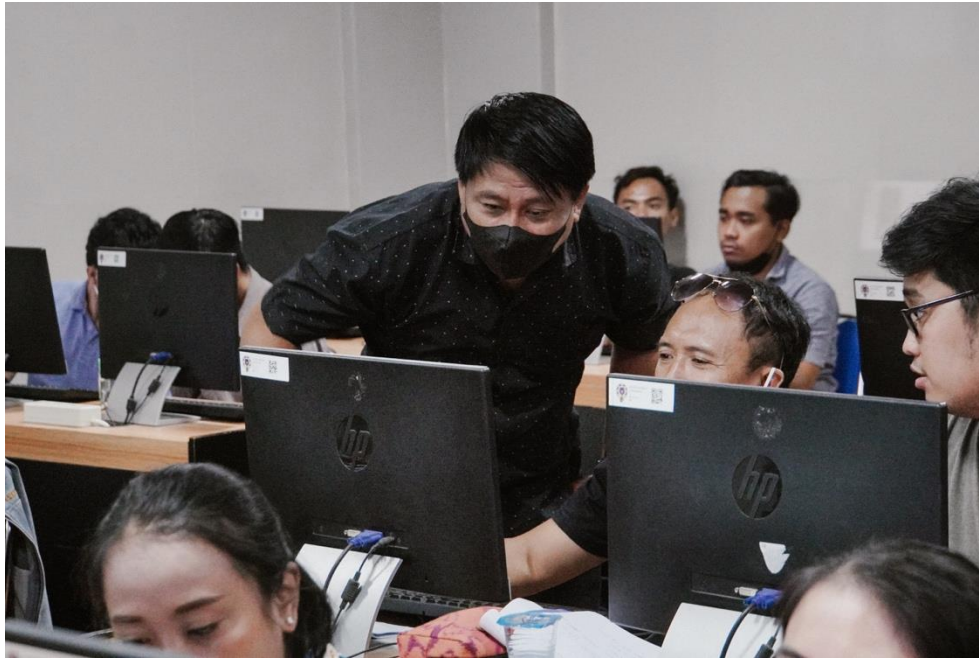
Gambar 4. Situasi pelatihan hari kedua