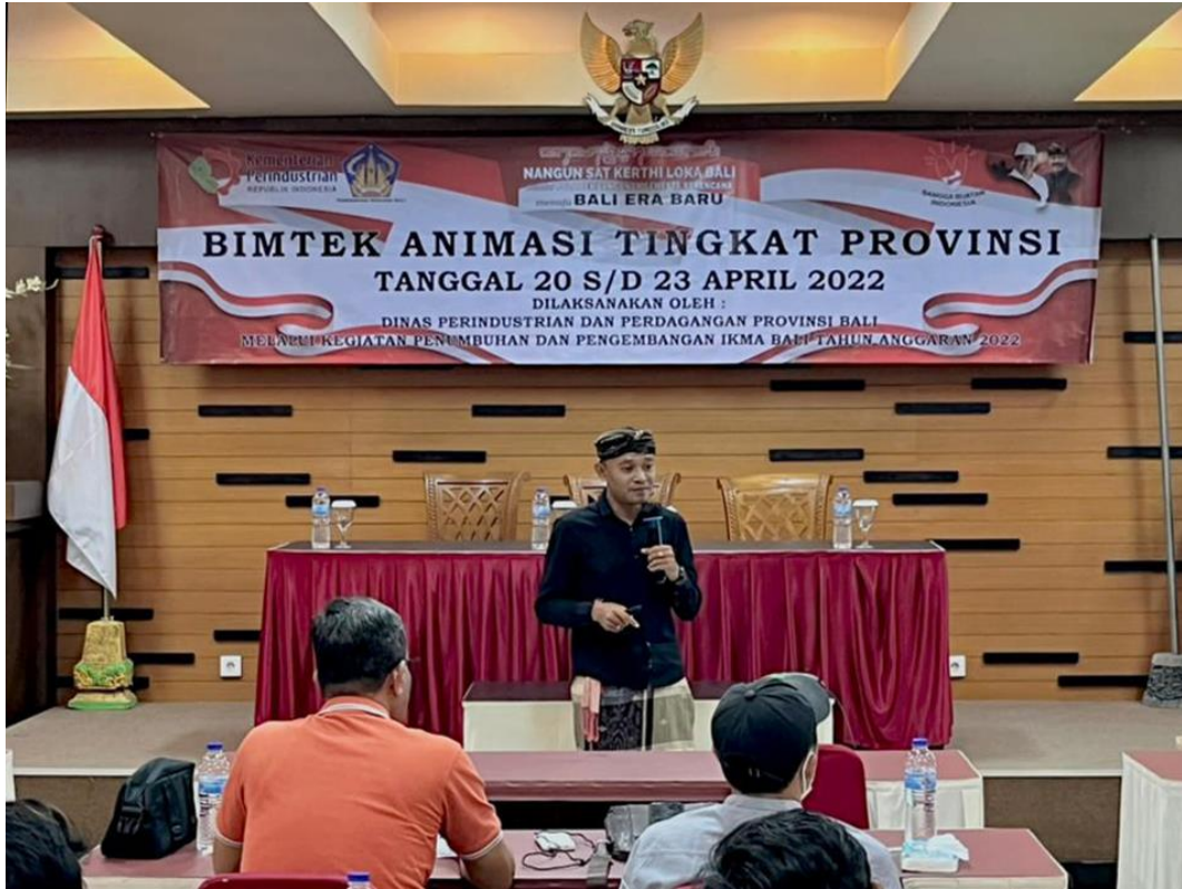
Gambar 2. Pembukaan Kegiatan Bimtek Animasi