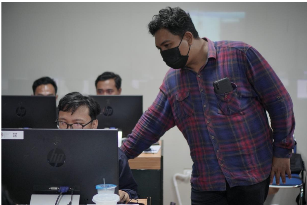
Gambar 3. Situasi pelatihan hari pertama