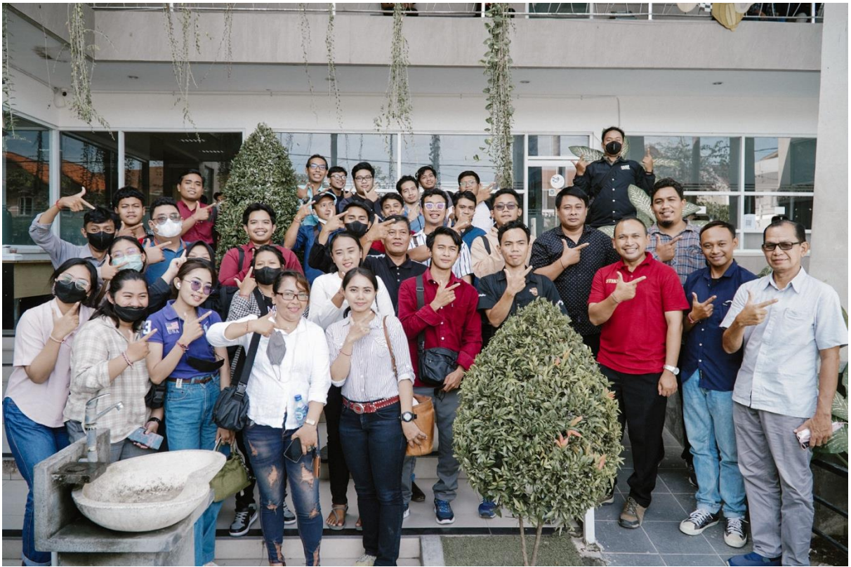
Gambar 6. Foto bersama di hari terakhir pelatihan