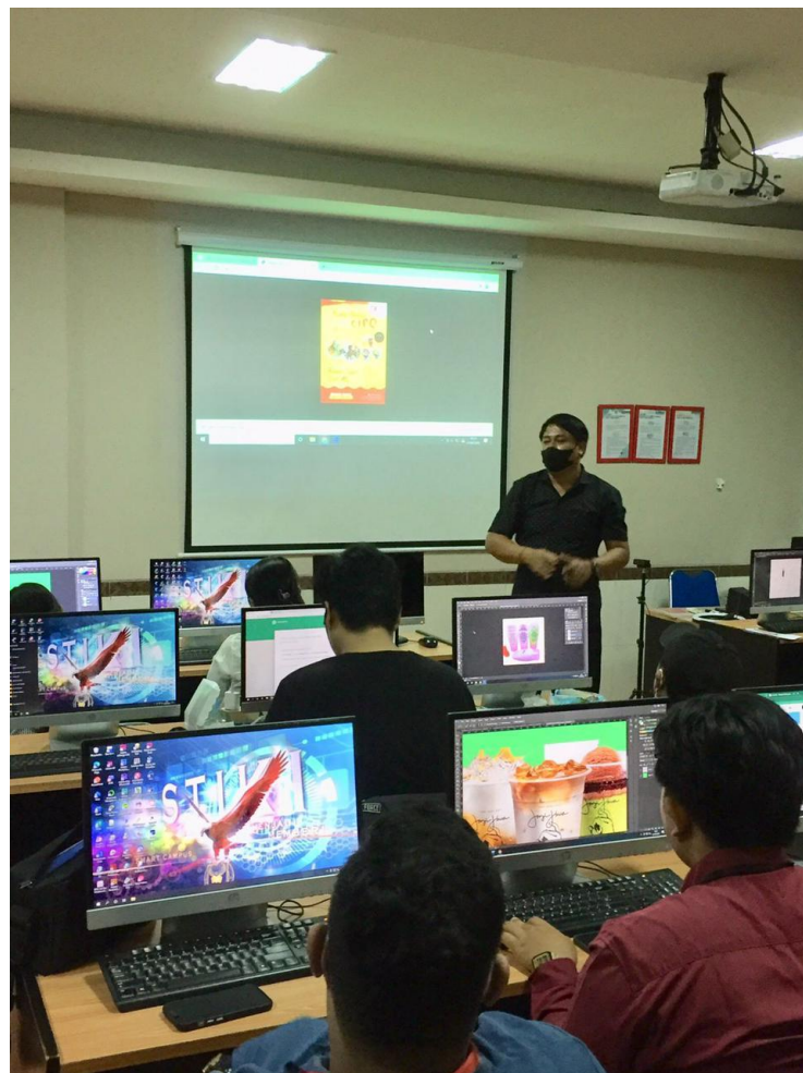
Gambar 5. Situasi pelatihan hari ketiga